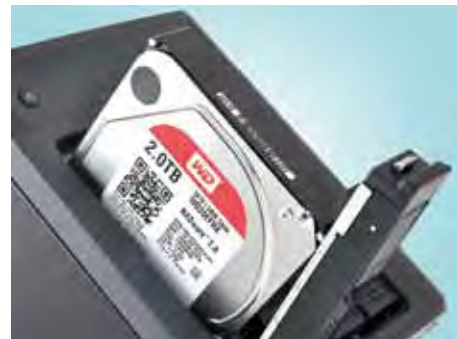
Oba NAS-a stigla su s po četiri WD-ova Red diska kapaciteta 2 TB. Riječ je o diskovima posebno namijenjenim za ugradnju u NAS-ove

Funkcionalnost NAS-a dodatno je moguće proširiti i prilagoditi instaliranjem posebnih aplikacija odnosno appova , no ponuda je