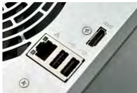
AS-204TE može se koristiti i kao multimedijски player jer ima HDMI i 3,5-milimetarski audioizlaz