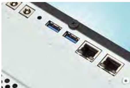
RAS mogućnosti WD-ova uređaja - dupli mrežni i napojni konektori. Za iskorištavanje potonje mogućnosti potrebno je kupiti dodatni adapter