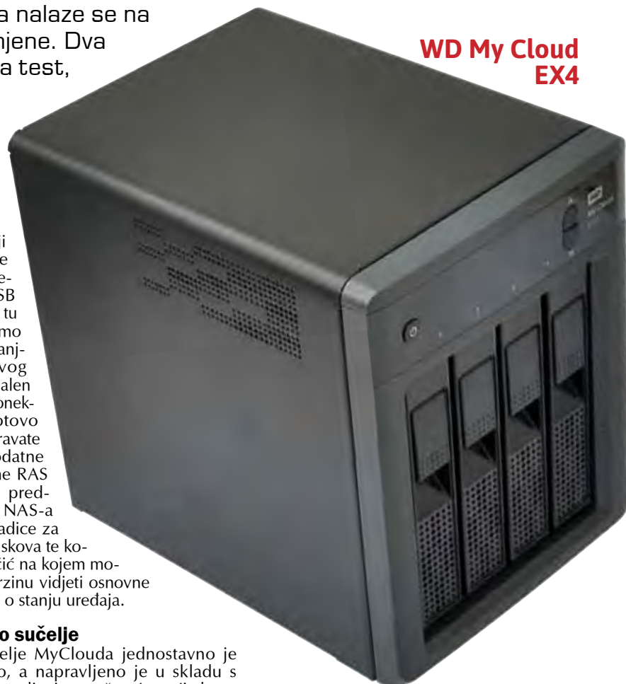
WD My Cloud EX4

Web sučelje MyClouda jednostavno je i stilizirano, a napravljeno je u skladu s reponzivnim dizajnom, što će reći da se lijepo skalira u skladu s veličinom ekrana.